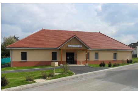
Mailly le camp

La maison médicale est récente, elle est située à proximité des commerces et de la Mairie. Elle abrite 2 médecins (départ en retraite) 1 diététicien (mi-temps) 1 kinésithérapeute et 2 infirmières . Le village est situé entre les vignobles et les lacs. Bourg centre de 1800 habitants doté de commerces et services et d'un tissu associatif riche et dynamique vers lequel sont tournés tous les villages environnants dans un rayon de 15/20 kms représentant une population de 5000 habitants.